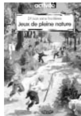
Réalisé par le Groupe national de recherche des Ceméa « Jeux et pratiques ludiques ».

Pour commander cette publication, adressez-vous à votre AT ou à Ceméa Publications, 24, rue Marc Seguin 75883 Paris Cedex 18 Tél. 01 53 26 24 41